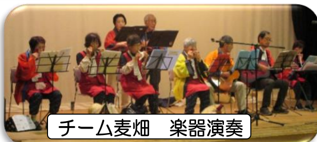
チーム麦畑 楽器演奏