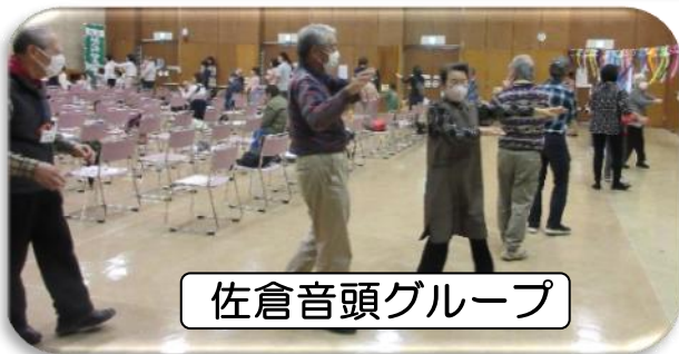
佐倉音頭グループ