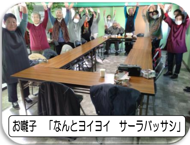
お囃子 「なんとヨイヨイ サラバッサシ」